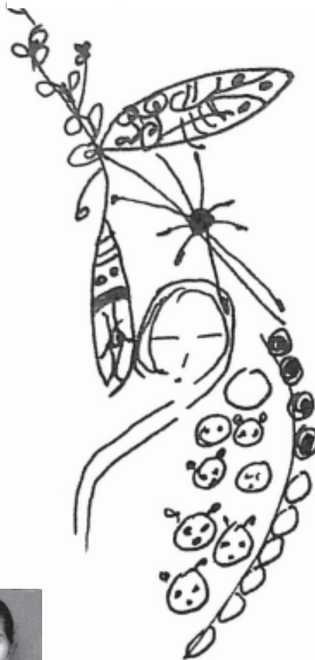
ಚಿತ್ರಗಳು : ನಿಜಯುಕ್ತಿ ಹಾಲಾಡಿ