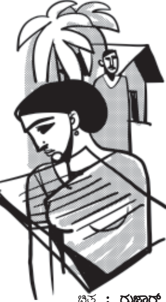
ಚಿತ್ರ : ನುಣ್ಣೂರ್

ಅಂದು ಅವಳ ಬದುಕಿನ ಮೊದಲ ಕವಿಗೋಷ್ಠಿಯ ದಿನ. ಒಲೆಯ ಉರಿ ಜಾಸ್ತಿಯಾಗಿ ತೆಳ್ಳವು ಕೆಂಪಾಗಿ ಸೀದುವಹೋಗಲು ಶುರುವಾದರೂ ಅವಳ ಗ್ಯಾನ ಎಲ್ಲೋ ತಾಳ ತಪ್ಪಿದಂತಿತ್ತು. ಒಂಭತ್ತರ ಬಸ್ಸು ತಪ್ಪಿಹೋದರೆ ಎಂಬ ಧಾವಂತ. ತೋಟದಸಾಲು ದಾಟಿ ಆ ದೊಡ್ಡ ಗುಡ್ಡ ಹತ್ತಿ ಮೂರ್ನಾಲ್ಕು ತಿರುವುಗಳಲ್ಲಿ ತಿರುಗಿ ಬಸ್ ನಿಲುಗಡೆಯ ಸ್ಥಳಕ್ಕೆ ಹೋಗಬೇಕು. ಎಷ್ಟೋ ಸಲ ಕೊನೇ ತಿರುವಿನ ಹತ್ತಿರಹತ್ತಿರ ಹೋಗುತ್ತಿದ್ದಾಗ ಬಸ್ ತಪ್ಪಿದ್ದೂ ಇದೆ. ಈ ಕವಿಗೋಷ್ಠಿ ತಪ್ಪಿಹೋದರೆ ತನ್ನ ಕನಸುಗಳೆಲ್ಲ ತೆಳ್ಳವಿನ್ನಂತೆ ಕರಕಲಾಗಿ ಹೋಗುವುದೇ ಸೈ ಅನಿಸಿತ್ತವಳಿಗೆ. ರಾತ್ರಿಯಿಡೀ ಕವಿತೆಯನ್ನು ತಿದ್ದಿ ತೀಡಿ ಬರೆದಿಟ್ಟುಕೊಂಡಿದ್ದಳು. ಬಿಳಿಹಾಳೆಯ ಸುತ್ತ ಕಪ್ಪು ಬಾರ್ಡರ್ ಹಾಕಿ ಶೃಂಗರಿಸಿದ್ದೇನು.. ಕಿಂಪುಶಾಯಿಯಲ್ಲಿ ಹೆಡ್ಡಿಂಗ್ ಬರೆದ್ದೇನು... ಅದೇ ಕೆಂಪಿನಲ್ಲಿ ಕವಿತೆಯ ಕೆಳಗೆ ತನ್ನ ಹೆಸರು ಮೂಡಿಸುವಾಗ ವಿಚಿತ್ರ ರೋಮಾಂಚನವಾಗಿತ್ತು. ಹೆಸರಿನ ಕೊನೆಯಲ್ಲಿ ಅಚಾನಕ್ಕಾಗಿ ಇಟ್ಟ ಚುಕ್ಕೆ ಅವಳನ್ನು ಚಕಿತಗೊಳಿಸಿತ್ತು. ಆ ಚುಕ್ಕೆ ತನ್ನದೇ ಪ್ರತಿರೂಪವೆನಿಸತೊಡಗಿತ್ತು.