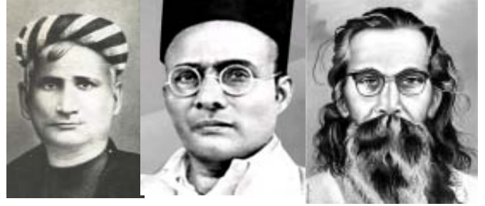
ಬಂಗಾಂ ಚಂದ್ರ ಚಟರ್ಜಿ ವಿ.ಡಿ. ಸಾವರ್ಕರ್ ಎಂ.ಎಸ್. ಗೋಲ್ವಾಲ್ಕರ್

ರಾಷ್ಟ್ರ ಎನ್ನುವ ಪರಿಕಲ್ಪನೆ ಆಧುನಿಕತೆ ಮತ್ತು ಬಂಡವಾಳಶಾಹಿಯ ಉಗಮದೊಂದಿಗೆ ಯುರೋಪಿನಲ್ಲಿ ಪ್ರಾರಂಭವಾದದ್ದು ನಿಮಗೆಲ್ಲ ತಿಳಿದೇ ಇರುವಂತಹ ಸಂಗತಿ. ಯುರೋಪಿನಲ್ಲಿ ಭಾಷೆಗಳು ಹರಳುಗಟ್ಟಿ ಸ್ಪ್ಯಾಂಡರ್ಸ್ಟ್ರಾ ಆಗುವುದರ ಮೂಲಕ ಆ ಭಾಷೆ ಒಂದು, ಆ ಭಾಷೆಯನ್ನು ಆಡುವ ಜನರೆಲ್ಲ ಒಂದು ಮತ್ತು ಆ ಭಾಷೆಯನ್ನು ಆಡುವ ಜನರುಗಳು ವಾಸಿಸುವ ಪ್ರದೇಶ, ತನ್ನದೇ ಆದ ಸ್ವಾಯತ್ತತೆಯನ್ನು ಹೊಂದಿರಬೇಕು ಮತ್ತು ಅದಕ್ಕೊಂದು ಗಡಿ ಇರಬೇಕು, ಆ ಗಡಿಗೊಂದು ತನ್ನದೇ ಆದ ಪ್ರಭುತ್ವ ಇರಬೇಕು ಎನ್ನುವ ತಿಳುವಳಿಕೆಯೊಂದಿಗೆ ರಾಷ್ಟ್ರೀಯತೆ ಕಾಣಿಸಿಕೊಂಡಿತು. ಆದರೆ ಭಾರತದ ಸಂದರ್ಭದಲ್ಲಿ ಈ ರಾಷ್ಟ್ರ ಪ್ರಭುತ್ವದ ಪರಿಕಲ್ಪನೆ ಪ್ರಾರಂಭಗೊಂಡಿದ್ದು ೧೯ನೇ ಶತಮಾನದ