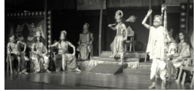
'ಕುರುಕ್ಷೇತ್ರ' ಪೌರಾಣಿಕ ನಾಟಕದ ಒಂದು ದೃಶ್ಯ

ಅದೇನೇ ಇರಲಿ, ರಂಗಶಿಕ್ಷಣಾರ್ಥಿಗಳಿಗೆ ಕನ್ನಡ ಕಾವ್ಯಪರಂಪರೆಯೊಂದಿಗೆ ಮುಖಾಮುಖಿ ಮಾಡಿ ಅದರ ರುಚಿ ಹತ್ತಿಸಲು ನಡೆಸಿರುವ ಈ ಪ್ರಯೋಗ ನೀನಾಸನ ಸಾಂಸ್ಕೃತಿಕ ಸೃಜನಶೀಲತೆ ಮತ್ತು ಸಾಹಸಶೀಲತೆಗೆ ಸಾಕ್ಷಿಯೆನಿಸಿತು. ಸಂಬಂಧಪಟ್ಟ ಕರಪತ್ರದಲ್ಲಿ ಶಿಕ್ಷಣಾರ್ಥಿಗಳು 'ಕಾವ್ಯ ಅಂದರೆ ಏನರಿ?' ಎಂಬ ಪ್ರಶ್ನೆಗೆ ದಾಖಲಿಸಿರುವ ಉತ್ತರಗಳು ಸಾಕಷ್ಟು ಸ್ವಾರಸ್ಯಕರವೂ, ಕುತೂಹಲಕಾರಿಯೂ ಆಗಿದ್ದು ನೀನಾಸನ ಈ ಪ್ರಯತ್ನ ಶಿಕ್ಷಣಾರ್ಥಿಗಳ ನೆಲೆಯಿಂದಲೂ ಸಾರ್ಥಕವಾದಂತೆ ಕಾಣುತ್ತದೆ. ಆದರೆ ಈ ಕಾವ್ಯಭಾಗಗಳ ಮತ್ತು ಪದ್ಯಗಳ ಆಯ್ಕೆಯ ಮಾನದಂಡದ ಅಸ್ಪಷ್ಟತೆ ಈ ಪ್ರಯೋಗಕ್ಕೊಂದು ದೃಷ್ಟಿಕೇಂದ್ರವಿಲ್ಲದಂತೆ ಮಾಡಿದೆ. ಇದರಿಂದಾಗಿಯೇ, ಮೊದಲ ಭಾಗದಲ್ಲಿ ರಗಳೆಯ ಒಂದು ತುಣುಕಾದರೂ ಇಲ್ಲದಿದ್ದುದು ಮತ್ತು ಎರಡನೇ ಭಾಗದಲ್ಲಿ ಕುವೆಂಪು ಕಾಣೆಯಾಗಿದ್ದುದು ಏಕೆಂದು ಗೊತ್ತಾಗಲಿಲ್ಲ.