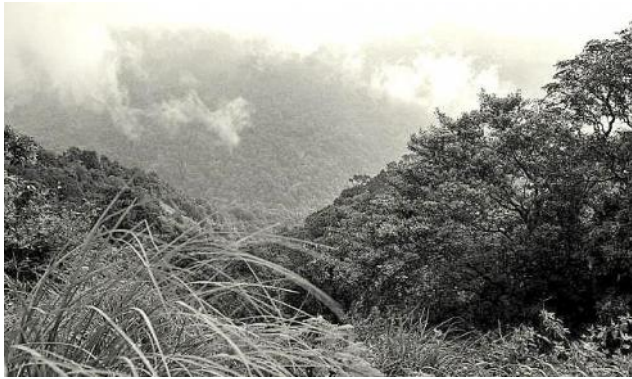
ಪಶ್ಚಿಮ ಘಟ್ಟಗಳ ಒಂದು ರುದ್ರ ರಮಣೀಯ ನೋಟ

ಕಡೆಗೂ ಕರ್ನಾಟಕ ಸರ್ಕಾರ ಕಸ್ತೂರಿ ರಂಗನ್ ವರದಿಯನ್ನು ಅನುಷ್ಠಾನಗೊಳಿಸಲು ತಾನು ಸಿದ್ಧವಿಲ್ಲ ಎಂಬ ಪತ್ರವನ್ನು ಕೇಂದ್ರ ಪರಿಸರ ಅರಣ್ಯ ಹಾಗೂ ಹವಾಮಾನ ಬದಲಾವಣೆ ಸಚಿವಾಲಯಕ್ಕೆಪತ್ರ ಬರೆದು ತಿಳಿಸಿದೆ. ೨೪.೦೪.೨೦೧೫ ರಂದು ಬರೆದ ಪತ್ರದಲ್ಲಿ ಪರಿಸರ ಸೂಕ್ಷ್ಮ ಗ್ರಾಮಗಳ( ಆಯ್ಕೆ ವಸ್ತುನಿಷ್ಠವಾಗಿಲ್ಲ ಹಾಗೂ ಬೇಕಾಬಿಟ್ಟಿಯಾಗಿದೆ ಎಂಬ ಆಪಾದನೆಯನ್ನು ಮಾಡಲಾಗಿದೆ. ಅಲ್ಲಿಗೆ ಕಸ್ತೂರಿ ರಂಗನ್ ವರದಿಗೆ ಅಂತಿಮ ತೆರೆ ಬಿದ್ದಂತೆಯೇ ಆಗಿದೆ. ಕೇರಳ ಈಗಾಗಲೇ ಅದನ್ನು ತಿರಸ್ಕರಿಸಿದೆ.