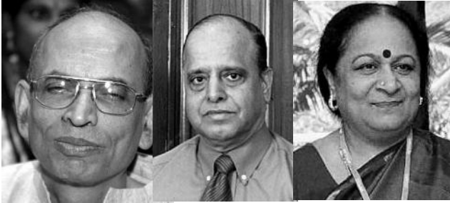
ಮಾಧವ ಗಾಡ್ಗೀಳ್ ಕಸ್ತೂರಿ ರಂಗನ್ ಜಯಂತಿ ನಟರಾಜನ್

ಇಲ್ಲಿನ ಅರಣ್ಯಗಳು ಮಳೆ ನೀರನ್ನು ಭೂಮಿಯಲ್ಲಿ ಇಂಗಿಸಿ, ವರ್ಷವಿಡೀ ಹರಿಯುವ ಸಹಸ್ರಾರು ಜಲಮೂಲಗಳಿಗೆ ಕಾರಣವಾಗಿವೆ. ದಕ್ಷಿಣ ಭಾರತದ ಬಹುತೇಕ ಎಲ್ಲಾ ನದಿಗಳೂ ಪಶ್ಚಿಮ ಘಟ್ಟಗಳಲ್ಲಿಯೇ ಹುಟ್ಟುತ್ತವೆ. ಪಶ್ಚಿಮ ಘಟ್ಟಗಳಲ್ಲಿ ಹುಟ್ಟಿ ಪೂರ್ವಕ್ಕೆ ಹರಿದು ಬಂಗಾಳ ಕೊಲ್ಲಿ ಸೇರುವ ಕೃಷ್ಣಾ ನದಿ ಹಾಗೂ ಅದರ ಉಪನದಿಗಳು, ತುಂಗಭದ್ರಾ ಹಾಗೂ ಅದರ ಉಪನದಿಗಳು ಮತ್ತು ಕಾವೇರಿ ಹಾಗೂ ಅದರ ಉಪನದಿಗಳು ಮಹಾರಾಷ್ಟ್ರ, ಕರ್ನಾಟಕ, ಆಂಧ್ರ ಮತ್ತು ತಮಿಳುನಾಡು ರಾಜ್ಯಗಳ ಜೀವನಾಡಿಗಳಾಗಿವೆ. ಈ ರಾಜ್ಯಗಳ ಕೃಷಿ, ಕೈಗಾರಿಕೆ, ಜನಜೀವನ, ಸಂಸ್ಕೃತಿ ಎಲ್ಲವೂ ಈ ನದಿ ಸಮೂಹಗಳ ಮೇಲೆಯೇ ಅವಲಂಬಿತವಾಗಿವೆ. ಹಾಗೆಯೇ ಪಶ್ಚಿಮ ಘಟ್ಟಗಳಲ್ಲಿ ಹುಟ್ಟಿ ಪಶ್ಚಿಮಕ್ಕೆ ಹರಿದು ಅರಬ್ಬಿ ಸಮುದ್ರ ಸೇರುವ ಶರಾವತಿ, ಕಾಳಿ, ಅಘನಾಶಿನಿ, ಬೆಡ್ಡಿ, ನೇತ್ರಾವತಿ ಮುಂತಾದವು ಜಲವಿದ್ಯುತ್ತಿನ ಮೂಲಗಳಾಗಿವೆ. ಪಶ್ಚಿಮ ಘಟ್ಟಗಳನ್ನು