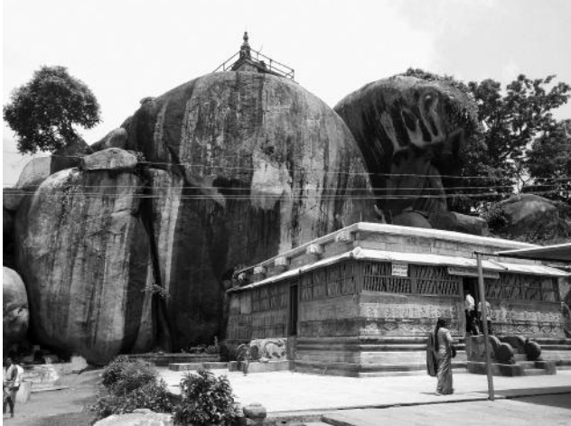
ಚಂದ್ರಗುತ್ರಿಯ ರೇಣುಕಾದೇವಿಯ ಗುಡಿ