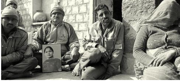
ಪೋಖ್ರಾನ್‌ನಲ್ಲಿ ಕ್ಯಾನ್ಸರ್ ಸಂತ್ರಸ್ತರು