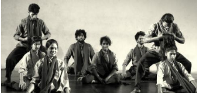
'ಕವಿತೆ ಎಂದರೆ ಏನರಿ?' ಕನ್ನಡ ಕಾವ್ಯಗಳ ರಂಗಪ್ರಸ್ತುತಿಯು ಒಂದು ದೃಶ್ಯ

ಹೆಗ್ಗೋಡಿನ ನೀನಾಸನ ರಂಗಶಿಕ್ಷಣ ಕೇಂದ್ರದ ೨೦೧೪-೧೫ನೇ ಸಾಲಿನ ವಿದ್ಯಾರ್ಥಿಗಳು ಕಳೆದ ಮೇ ೧೧ರಿಂದ ೧೪ರವರೆಗೆ ತಮ್ಮ ಪಠ್ಯಕ್ರಮದ ಭಾಗವಾಗಿ ಅಭ್ಯಾಸ ಮಾಡಿದ ಐದು ವಿಭಿನ್ನ ರಂಗಪ್ರದರ್ಶನಗಳನ್ನು ಸಾರ್ವಜನಿಕರಿಗೆ ನೀಡಿದರು. ಅವುಗಳಲ್ಲಿ ನಾನು ನೋಡಿದ ಎರಡು ಪ್ರದರ್ಶನಗಳ ಬಗ್ಗೆ ಇಲ್ಲಿ ಬರೆಯುತ್ತಿದ್ದೇನೆ.