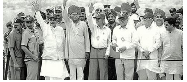
ಅಣ್ವಸ್ತ ಸ್ಥೋಟದ ಸಂಭ್ರಮದಲ್ಲಿ ಪ್ರಧಾನಿ ವಾಜಪೇಯಿ ಹಾಗೂ ಇತರರು

ಅಂತಿಮವಾಗಿ ಮನುಷ್ಯಕುಲದ ಅಸ್ತಿತ್ವಕ್ಕೆ ಮಾರಕವಾಗುವ ವಿಕಿರಣ ಸಾಧನಗಳನ್ನೇ ಅಭಿವೃದ್ಧಿ ಎಂದು ಭಾವಿಸಿ ವಿನಾಶದತ್ತ ಸಾಗುತ್ತಿರುವ ಆಧುನಿಕ ಮಾನವ ನೂರಾರು ಜ್ಯೋತಿರ್ವರ್ಷಗಳ ಆಚಿಗಿನ ಜಗತ್ತನ್ನು ಅನ್ವೇಷಿಸುವ ಉಮೇದಿನಲ್ಲಿ ತನ್ನ ಅಸ್ತಿತ್ವದ ಏಕೈಕ ನೆಲೆಯಾದ ಈ ಭೂಮಿಯನ್ನೇ ನರಕವಾಗಿಸುತ್ತಿರುವುದು ವಿಪರ್ಯಾಸ. ಕ್ಷಣಮಾತ್ರದಲ್ಲಿ ಇಡೀ ಭೂಮಂಡಲದ ಮೇಲಿನ ಸಮಸ್ತ ಜೀವರಾಶಿಯನ್ನು ನಿರ್ನಾಮಗೊಳಿಸಬಲ್ಲ ಅಣುಬಾಂಬುಗಳ ನಿರ್ಮಾಣ ಪ್ರಕ್ರಿಯೆಯ ಹಿಂದಿರುವ ಅಸಂಖ್ಯ ಘೋರ ಕಥಾನಕಗಳಲ್ಲಿ ರಾಜಾಸ್ತಾನದ ಪೋಖ್ರಾನ್‌ನದ್ದು ಸಹ ಒಂದು. ೧೯೭೪ರಲ್ಲಿ ಪ್ರಥಮ ಬಾರಿಗೆ ಇಲ್ಲಿನ ಭೂಗರ್ಭದೊಳಗೆ ನಡೆಸಲಾದ ಅಣುಸ್ಫೋಟ ಅಲ್ಲೊಂದು ನರಕವನ್ನೇ ಸೃಷ್ಟಿಸಿತ್ತು ಎಂಬುದು ಬೆಳಕಿಗೆ ಬರಲು ದಶಕಗಳೇ ಬೇಕಾಯಿತು.