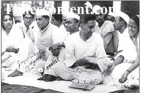
ಕಾಂಗ್ರೆಸ್ ಸೋಷಲಿಸ್ಟ್ ಪಕ್ಷದ ಸಭೆಯೊಂದರಲ್ಲಿ ಅರುಣಾ, ಆಸಿಫ್ ಅಲಿ, ಯೂಸುಫ್ ಮೆಹ್ತೋಲಿ, ಜೆ.ಪಿ. ಲೋಹಿಯಾ, ಪಟವರ್ಧನ್, ಮುಂತಾದವರು.