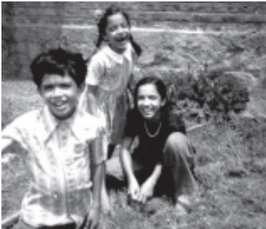
ತೋಟದಲ್ಲಿ ಮಕ್ಕಳ ಆಟ

ದೂರದಲ್ಲಿದ್ದುದರಿಂದ ಮತ್ತು ಮಕ್ಕಳಿಗೆ ಹಳ್ಳಿಯ ಜನಗಳ ಒಡನಾಟ ಇರಲಿ ಎಂಬ ಎರಡು ಕಾರಣಗಳಿಗೆ, ನಮ್ಮ ಮಕ್ಕಳನ್ನು ತೋಟದಿಂದ ೪ ಕಿಲೋಮೀಟರು ದೂರದಲ್ಲಿದ್ದ ಉದ್ಘರ ಎಂಬ ಹಳ್ಳಿಯಲ್ಲಿದ್ದ ಸರ್ಕಾರಿ ಶಾಲೆಗೆ ಕಳುಹಿಸುತ್ತಿದ್ದೆವು. ಪ್ರತಿದಿನ ಮಕ್ಕಳು