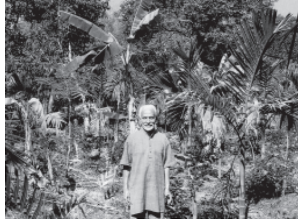
ತಮ್ಮ ಭೀಮನಕಟ್ಟೆ ತೋಟದಲ್ಲಿ ಲೇಖಕರು

ನಾವು ನೆಟ್ಟಿದ್ದ ನಿಂಬೆ, ಮೋಸಂಬಿ ಮತ್ತು ಕಿತ್ತಳೆ ಗಿಡಗಳಿಗೆ, ನೆಟ್ಟ ಮೊದಲ ವರ್ಷದಲ್ಲಿ ಒಂದು ಜಾತಿಯ ಹುಳು ಆ ಗಿಡಗಳ ಎಲ್ಲ ಎಲೆಗಳನ್ನೂ ತಿಂದು ಹಾಕಿತು. ನಮ್ಮ ತತ್ವಗಳಿಗನುಗುಣವಾಗಿ ನಾವು ಯಾವ ಔಷಧಿಯನ್ನೂ ಸಿಂಪಡಿಸಲಿಲ್ಲ. ಆ ಗಿಡಗಳಿಗೆ ಬೇಕಾದ ಆಹಾರಾಂಶಗಳು ನಮ್ಮ ಜಮೀನಿನಲ್ಲಿದ್ದೇ ಈ ಗಿಡಗಳು ಅಶಕ್ತವಾಗಿ ಹುಳುಗಳನ್ನು ಆಕರ್ಷಿಸಿರಬಹುದು ಅಥವಾ, ಇವನ್ನು ತಿನ್ನುತ್ತಿರುವ ಹುಳುಗಳಿಗೆ ಪ್ರಕೃತಿಯಲ್ಲಿ ವೈರಿ ಕೀಟಗಳು ಮುಂದಿನ ತಿಂಗಳುಗಳಲ್ಲಿ